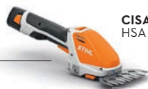
CISAILLE À MAIN HSA 26